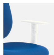
438 BI Coppia braccioli regolabili in nylon bianco. Pair of adjustable white nylon armrests.