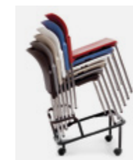
Carrello portasedie. Chairs trolley.