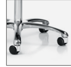
Optional: base in alluminio con ruote cromate Optional: aluminium base with chrome castors